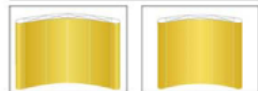
MP1 - 4x3, ref. 82204 2576 (al) x 2255 (al) x 940 (h) mm MP2 - 4x3, ref. 82214 3150 (al) x 2225 (al) x 960 (h) mm