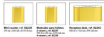
Mini counter, ref. 82238 270 (al) x 495 (al) x 1030 (h) mm