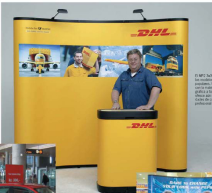
El MP2 3x3 curvo es uno de los modelos SnapUp más populares. En combinación con la maleta/visor, con gráfica a todo alrededor, le ofrece aún mayores posibilidades de crear esa imagen profesional deseada.

Las estructuras SnapUp permiten la rápida exposición de imágenes a gran escala. Texto y gráficos no se interrumpen provocando una total y mayor atracción.