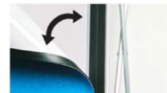
Una potente cinta magnética en la trasera de los paneles gráficos los fija de forma rápida y segura a la estructura.