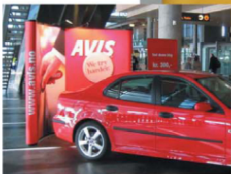
Todos los modelos estándar SnapUp se han diseñado para albergar paneles curvos en el extremo de cada estructura. Ofreciendo un lugar ideal para el nombre o logo de su compañía, dirección web, slogans de campaña, etc.