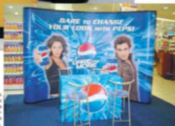
Como soporte PVC es impresionante, gracias a la fuerza cualitativa de sus grandes graficas, para promociones en Grandes Superficies.