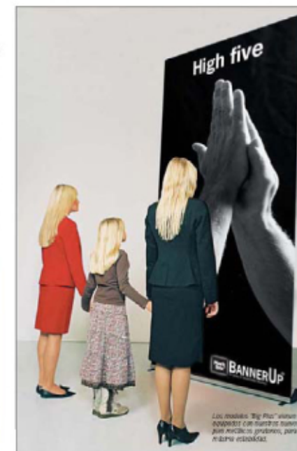
Los modelos "Big Plus" vienen equipados con nuestros nuevos paneles gráficos profundos, para máxima estabilidad.