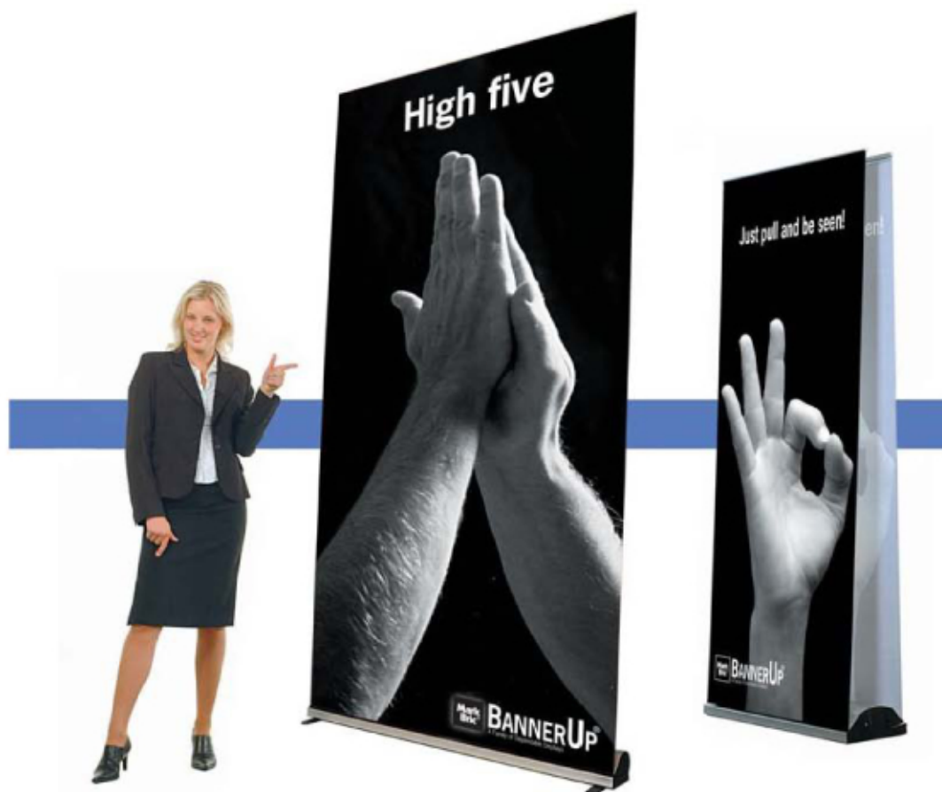
Nuevos BannerUp : Impresionante "Big Plus" y Doble cara "Double Plus"