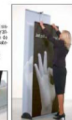
Tanto el "Big Plus" como el "Double Plus" tienen 10 años de garantía!