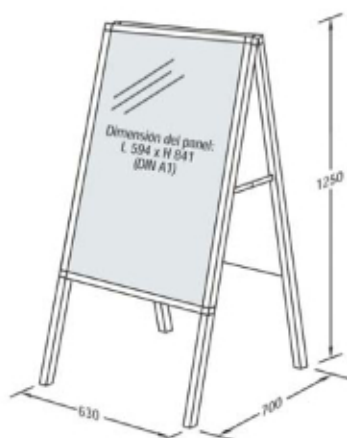
T-AS 1 Equipada con dos marcos