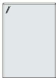
T-A A0 841 x 1189 mm