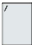
T-A A1 594 x 841 mm